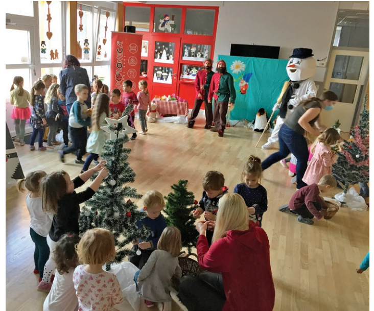
Brata Malek sta navdušila ...

Z otroki sta pela, plesala in jih povabila h krasitvi novoletnih smrečic. Ko je bilo vse pripravljeno za praznovanje, so priklicali tudi Božička. Razdelil jim je balončke in pobarvanke ter jim obljubil, da jih prihodnje leto ponovno obišče.