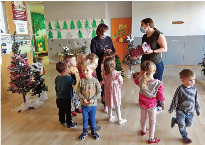
Podarili smo igro ...