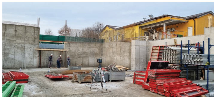
Dela še vedno tečejo po planu ...