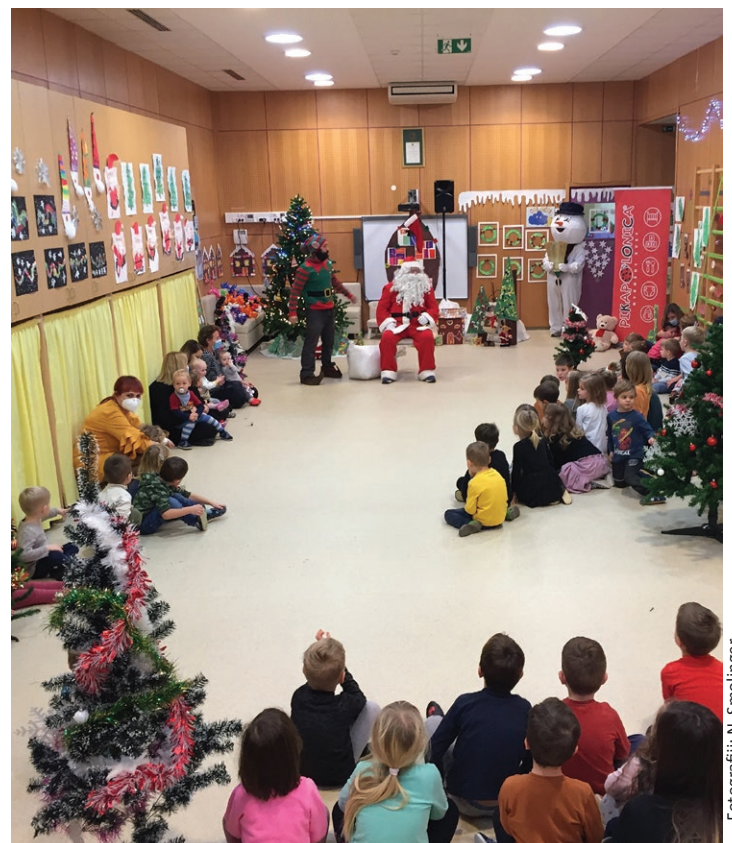
Tudi letos je Božiček v vrtcih obdaril najmlajše ...

Kolektiv vrtcev Najdihojca in Pikapolonica