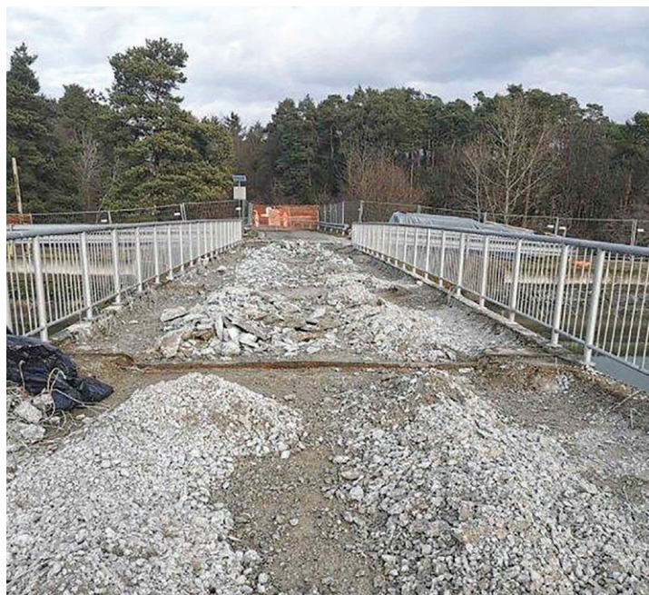
Most bo odprt junija ...

Sanacija bo predvidoma končana v juniju 2022.