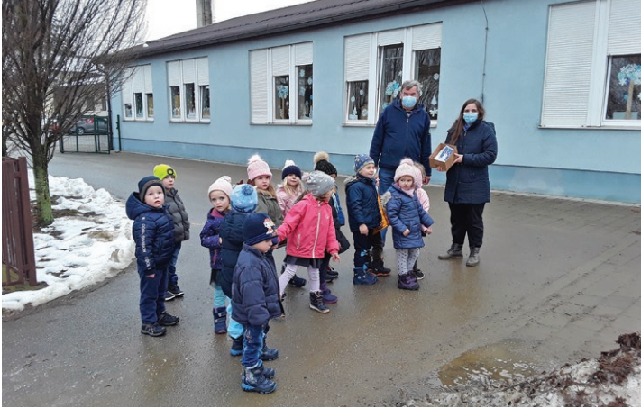
Izdelali smo voščilnice ...

V prazničnem decembru so želeli razveseliti starejše sokrajane. V vseh štirih oddelkih so izdelali 90 voščilnic, ki so jih s pomočjo Krajevne organizacije Rdečega križa Marjeta razdelili starostnikom v okoliških vaseh.